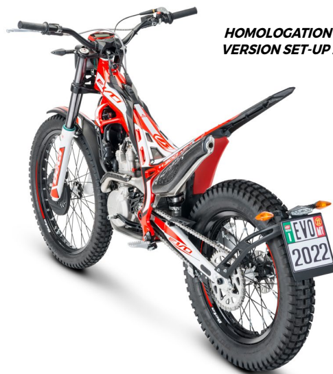
HOMOLOGATION VERSION SET-UP 2T/4T