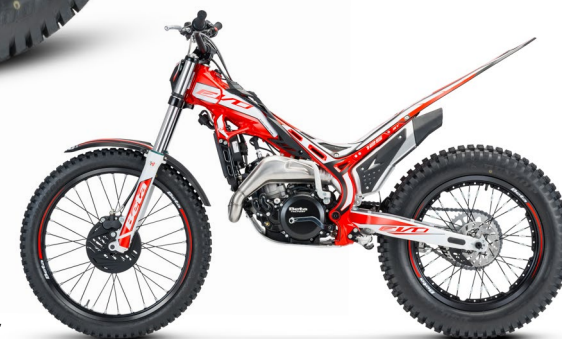
EVO 2T 125

125 2T: La più piccola delle moto omologabili della gamma. Leggera e maneggevole è adatta ai giovani piloti che provengono dalle classi inferiori e si avvicinano alle competizioni "da grandi". / 125 2T: The smallest homologation-ready bike in the range. Light and agile, this is perfect for young riders moving up from lesser classes and making their first forays into more serious competitions. / 125 2T: La plus petite des motos pouvant être homologuées de la gamme. Léger et maniable, elle convient aux jeunes pilotes venant des classes inférieures et abordant la compétition « comme des grands ». / 125 2T: Das kleinste der homologierbaren Motorräder der Baureihe. Leicht und wendig, ist es für die jungen Fahrer geeignet, die von den unteren Klassen kommen und sich den Rennen „der Großen“ annähern.